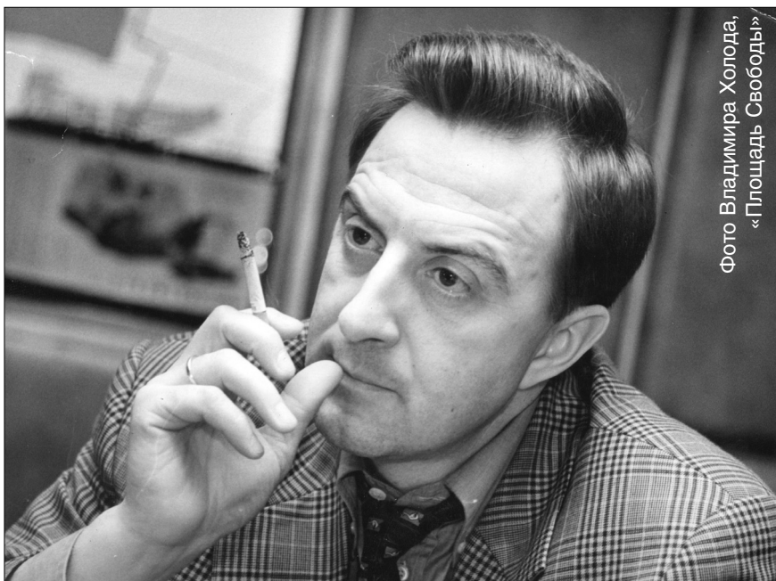
Фото Владимира Холода, «Площадь Свободы»

— Потому, что школа ВАЗа — это работа в интенсивном режиме. Когда не бегают к начальству за советом, а принимают решения сами, исходя из каких-то определенных условий, ресурсов,