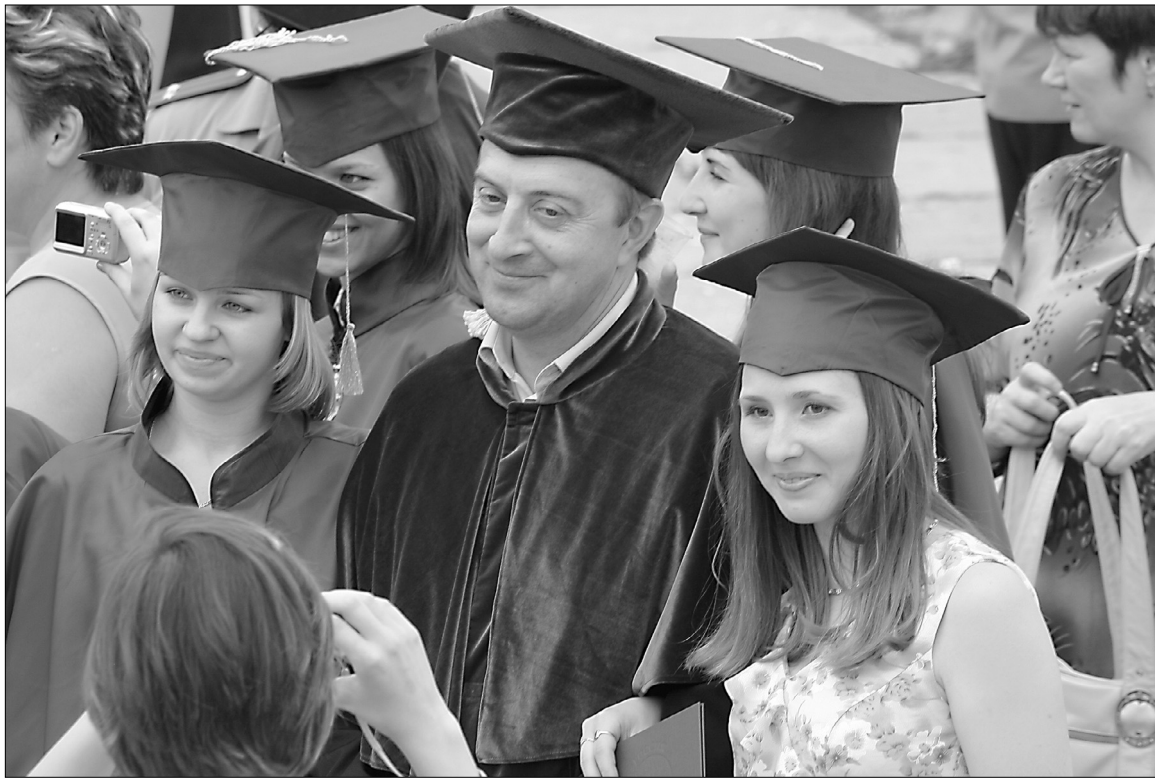
■ Университет — дело его жизни

23 мая во всех школах города пройдут последние звонки, 25 июня — выпускные вечера. И примерно 7,5 тысячи нынешних одиннадцатиклассников, небольшую долю которых составляют дети работников ВАЗа, окажутся перед выбором, как жить дальше. Что-либо советовать сложно, каждый вчерашний школьник должен сделать выбор самостоятельно (приняв во внимание разве что мнение родителей). Но поговорить на тему проблем и задач высшего образования самое время.