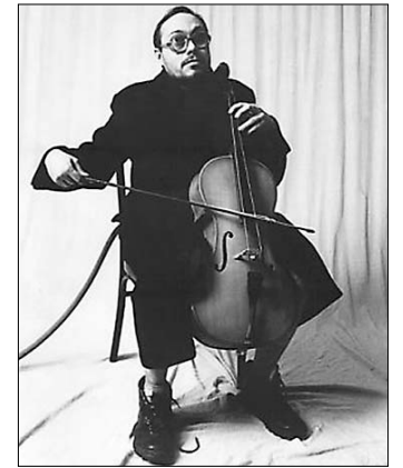
■ Поэт Айвенго в «Синей дыне»

Напоследок о концерте, на который я пойти не смогу, но определённую часть публики он явно заинтересует: 19 ноября в Тольятти состоится квартирник Джека из московского объединения «Медведь-Шатунь» .