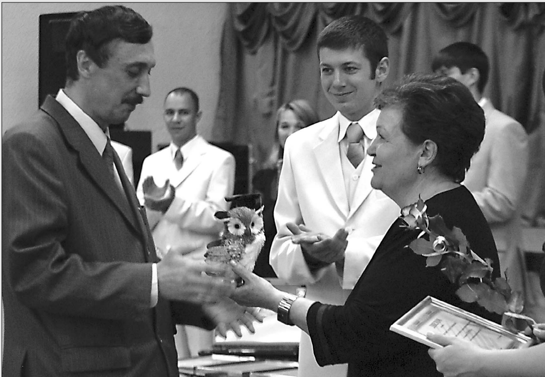
■ Позвольте пожать вам руку!

29 мая в нашем университете чествовали победителей первого конкурса профессионального мастерства преподавателей ТГУ. В актовом зале собрались все участники. Многих поддерживали коллеги и знакомые. Преподаватели радостно приветствовали друг друга и с нетерпением ждали оглашения результатов.