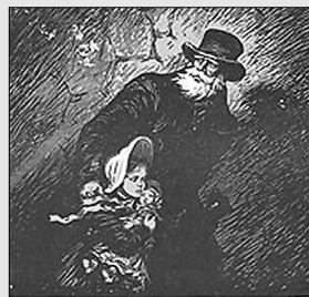
Виктор Гюго «ОТВЕРЖЕННЫЕ»