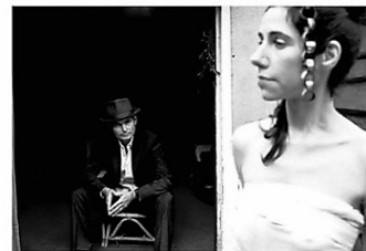
A Woman A Man Walked By