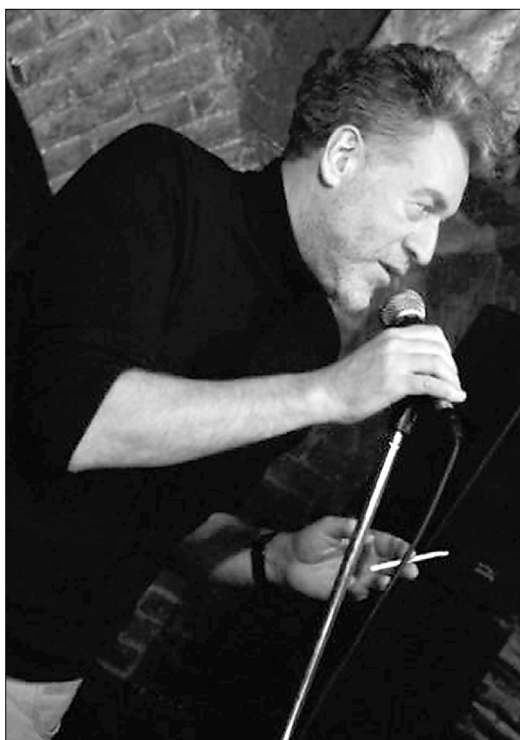
■ Артемий Троицкий минувшей осенью в Самаре

В разное время хэдлайнерами «Самого плохого» были «ЧайФ», «Карл и секция летальных аппаратов», «НОМ», «Ленинград», «Вопли Видоплясова», «АукцЫон». И вот случилось так, что самарцы созрели да реанимировали фестиваль! Осенью на нескольких площадках областной столицы прошли отборочные туры, куда тольяттинские рокеры ездили в качестве не только участников, но и гостей, в жюри тогда засветился некто Артемий Троицкий. А на этой неделе у нас пройдет один из концертов промо-тура — «Самый Плохой 2009» — TLT_PROMO_TOUR. Участвуют группы: «Shockers», «Ремонт», «Созидальный Исход» (все — Тольятти), «Samantha» (Новокуйбышевск), «РУКИ» и «MAD» (обе — Самара). Сие событие случится в субботу 18 апреля в филиале театра «Колесо» на проспекте Степана Разина (вход 150 р.). Если же кто решит посетить главные заключительные концерты фестиваля, то сообщаю — их будет всего два: 30 апреля (с 6 вечера до полуночи) и 1 мая (с 16.00 до 6 утра!). Групп очень много, их список можно посмотреть на официальном