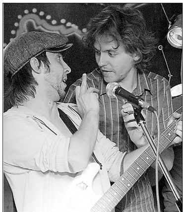
■ LEN&LUDWIG на LUDWIGparty

Начну, пожалуй, с традиционных мест. В апреле довольно актуально будет посещать Тольяттинский краеведческий музей. Там до 19 апреля работает фотовыставка «Году молодежи посвящается...». Что особенно приятно, это снимки студентов Тольяттинского государственного университета, ВУиТа, Самарской гуманитарной академии: портреты, пейзажи и связанные с учёбой и отдыхом. Так как экспозиция висит в холле — традиционном месте для бесплатных выставок, посетить её можно в любой день, кроме понедельника, совершенно бесплатно. А заодно узнать, как принять участие в конкурсе социальной фотографии «Легко ли быть молодым?» и очередном «Музейном пикнике». Фотоконкурс проводится с 1 по 30 апреля, итоговая выставка фотографий откроется в краеведческом