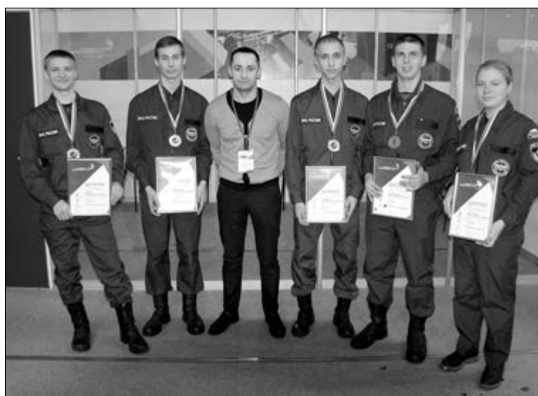
■ Команда ТГУ на чемпионате WorldSkills

С 23 по 25 ноября в Самарской области состоялся открытый региональный чемпионат «Молодые профессионалы» (WorldSkills Russia). Соревнования проходили по 41 компетенции WorldSkills и 5 компетенциям JuniorSkills на 10 конкурсных площадках. Основная площадка находилась в тольяттинском УСК «Олимп». В чемпионате приняла участие команда кафедры «Управление промышленной и экологической безопасностью» института машиностроения ТГУ.