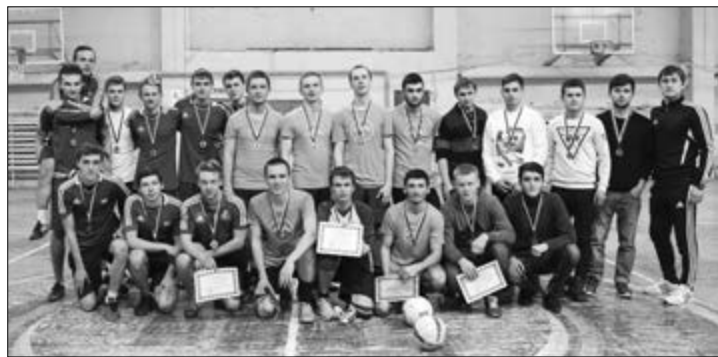
■ Победители и призеры универсиады по футболу

Отдельно нужно отметить болельщиков. Трибуны были заполнены до отказа, особо отличились ребята