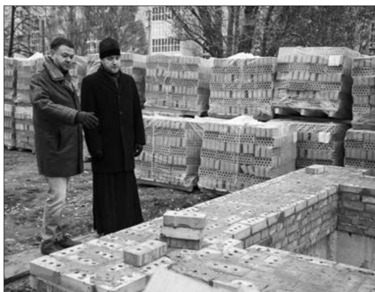
■ В 2017 году начнётся возведение стен университетского храма