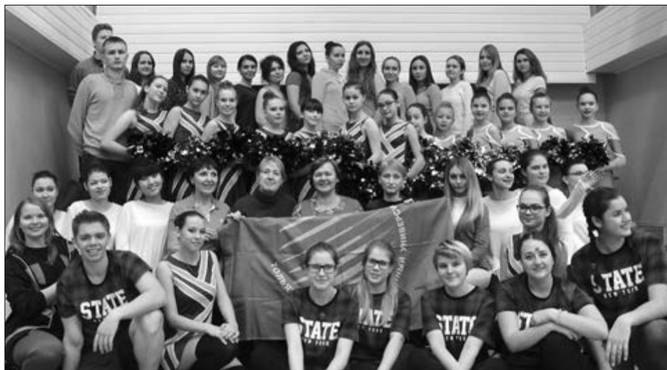
■ Аэробика — спорт оптимистов

«Фитнес конвенция» проводился с целью пропаганды и популяризации здорового образа жизни, фитнеса и аэробики среди школьников и молодёжи средствами общедоступных массовых физ-