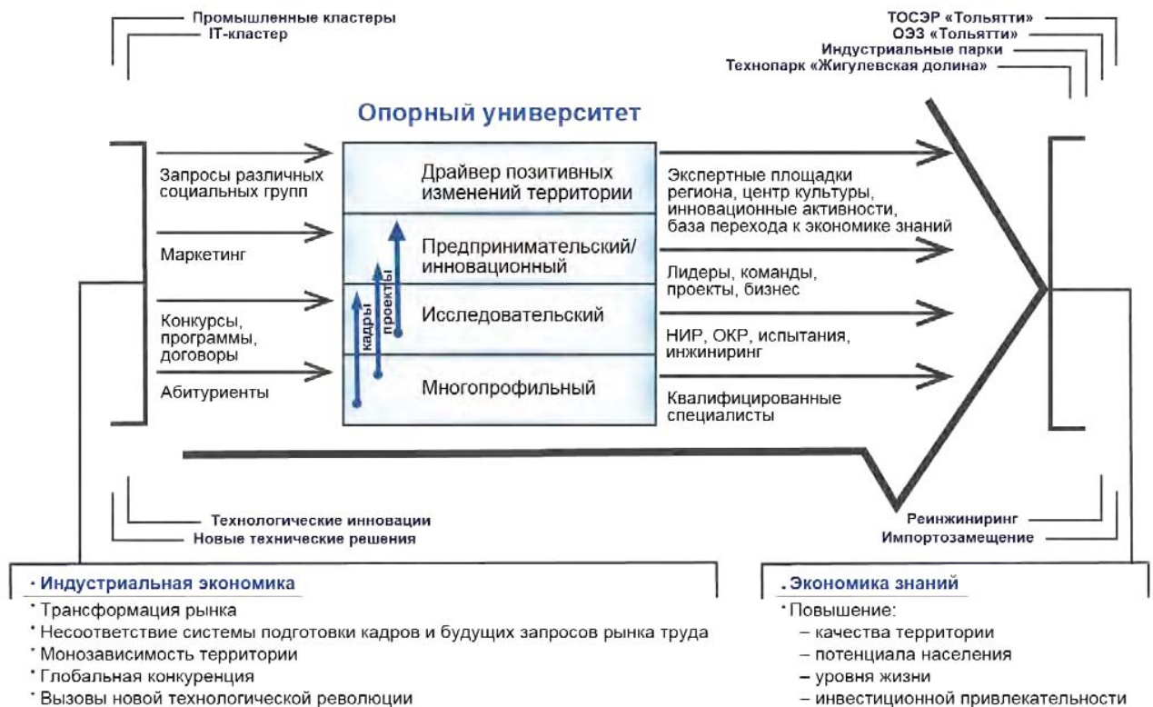
Рисунок 1 – Целевая модель опорного университета